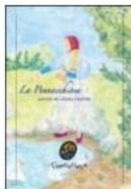
La Pennacchiosa - Fiaba antica